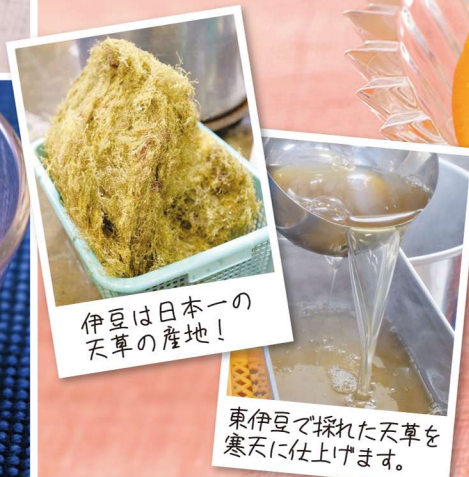
伊豆は日本一の天草の産地!

国内でも最高品質とされる東伊豆の天草を使用した寒天は、これぞ和菓子という夏の定番です。