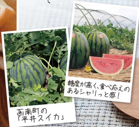
函南町の「平井すいか」